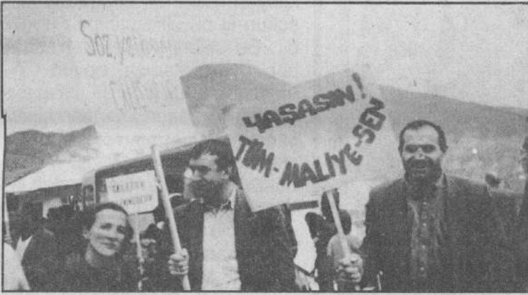
Artvin Kamu Çalışanları Mitingi

Miting aynı düzeyde başladığı gibi sona erdi.