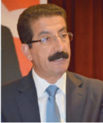
Lami Özgen KESK Genel Başkanı