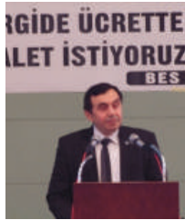
Ahmet Kesik BES Genel Başkanı