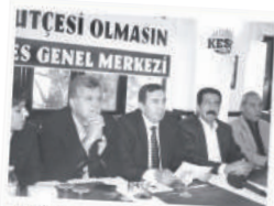
BES, 2013 BÜTÇESİNİ DEĞERLENDİRDİ: