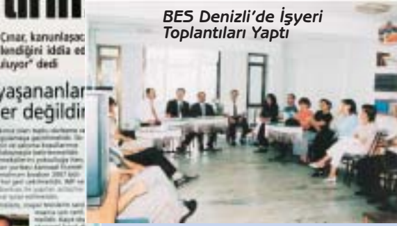
BES Denizli'de İşyeri Toplantıları Yaptı